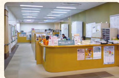
1F エントランスホール